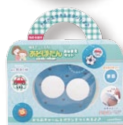
おなまえキット「まる」