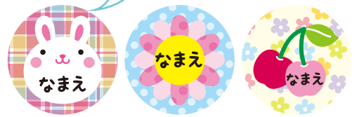
ボタン完成イメージ