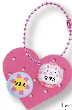
出来上がり イメージ