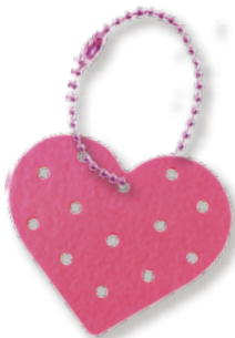
チャーム+チェーン