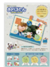
フォトフレームキット「お手紙」