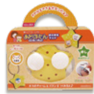
おなまえキット「ほし」