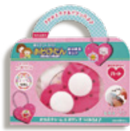
おなまえキット「ハート」