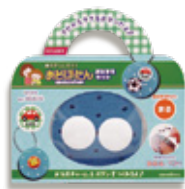
おなまえキット「まる」