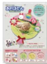
フォトフレームキット「花束」