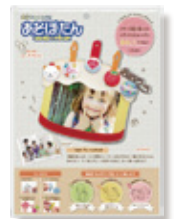
フォトフレームキット「ケーキ」