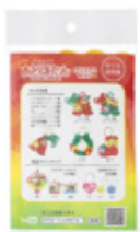
クリスマスキット