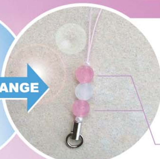
紫外線を浴びると